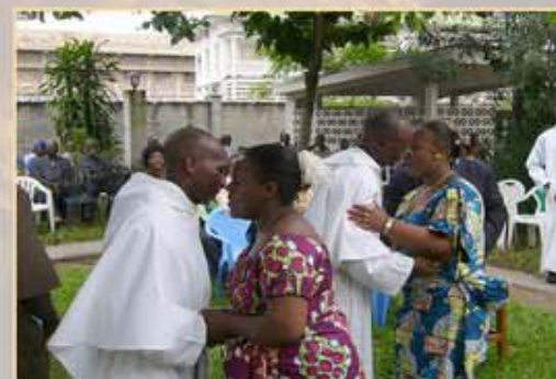
Professions religieuses au Congo R.D.C

Inspirés par l'exemple de la première communauté chrétienne et de la communauté augustiniennne , nous ne sommes jamais seuls sur le chantier du Royaume. Nous vivons en communauté apostolique. Cette communauté est un témoignage dans un monde individualiste, anticipant la venue d'un monde plus juste et plus convivial. Elle est le lieu de la vie fraternelle , empreinte de franchise et de cordialité , d'un véritable esprit de famille .