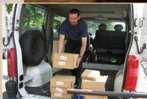
Banque alimentaire sur le bateau « Je sers » en région parisienne

" L'Esprit de notre fondateur nous pousse à faire nôtres les grandes causes de Dieu et de l'homme, à nous porter là où Dieu est menacé dans l'homme, et l'homme menacé comme image de Dieu" (RV§4). Aujourd'hui apparaissent de nouvelles formes d'exploitation liées à la mondialisation. Le nombre de personnes exclues ou blessées par la vie augmente ; entre riches et pauvres la fracture s'élargit. Nous ne devons pas être absents de tous les lieux où des hommes et des femmes luttent contre l'exploitation et l'exclusion.