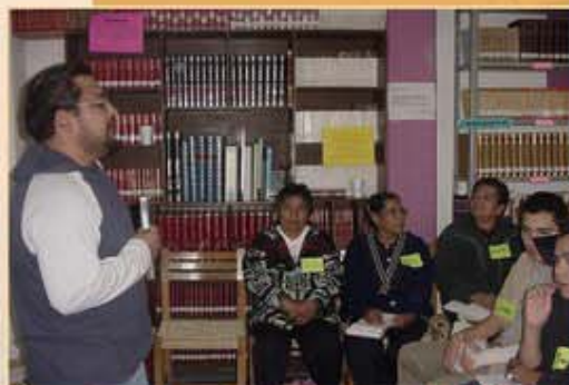
Formation de laïcs à Mexico

Membres d'une Congrégation aux moyens limités, nous voulons croire à l'utopie évangélique. Pour cela, avec d'autres, nous voulons structurer les personnes humainement, intellectuellement et spirituellement et construire un peuple pour Dieu.