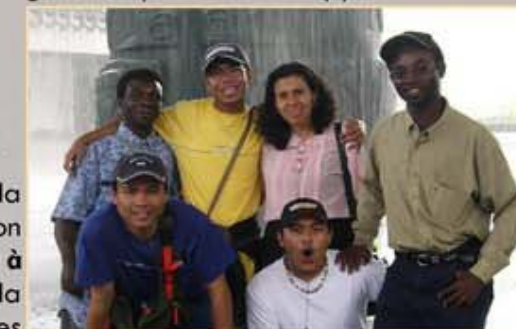
Congolais, Philippins et Mexicains

Le charisme de la famille de l'Assomption est un don de Dieu à l'Église . Il n'est pas la propriété privée des religieux(ses). Ce qui leur appartient, c'est la responsabilité de prendre soin de ce charisme et de le communiquer, d'être certains que le peuple de Dieu y a accès et peut en bénéficier.