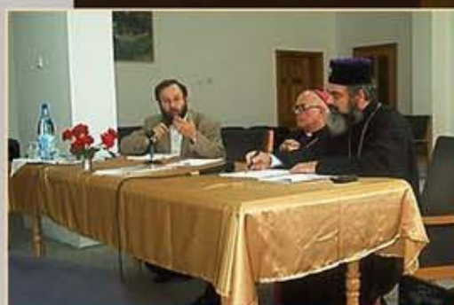
Session œcuménique avec le Métropolitain de Moldavie et le Nonce apostolique en Roumanie