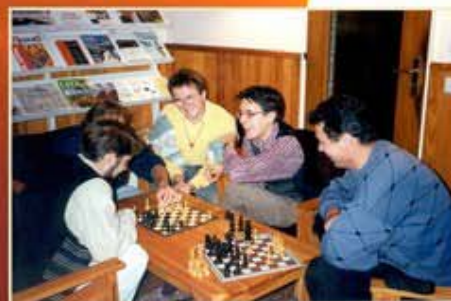
Communauté d'accueil de jeunes à Strasbourg (France)