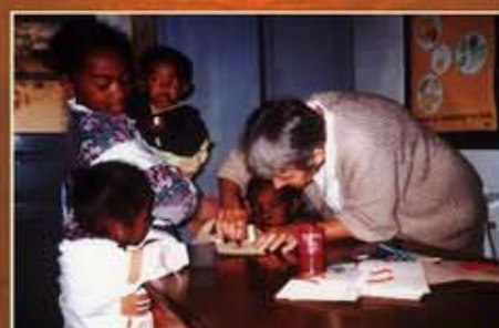
Petite Sœur de l'Assomption à Madagascar