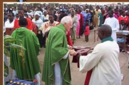
Messe en plein air à la nouvelle paroisse Ste Monique à Nairobi (Kenya)