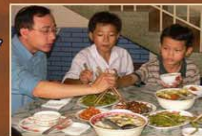
Assomptionniste de Saigon (Vietnam) à la maison d'accueil des enfants des rues