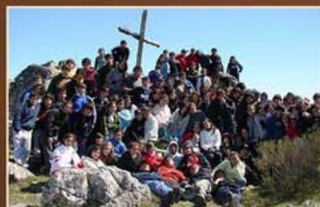
Pastorale-jeunesse en Argentine Institut « San Roman »