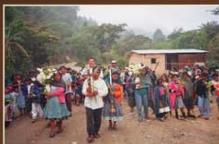
Semaine Sainte avec des populations autochtones au Mexique