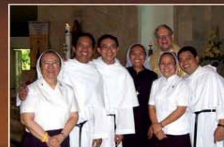
Assomptionnistes et Religieuses de l'Assomption aux Philippines