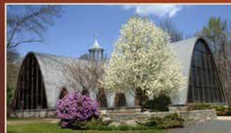
Chapelle du Saint Esprit à Assumption College (USA)