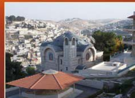
Jérusalem, Communauté de St-Pierre en Gallicante